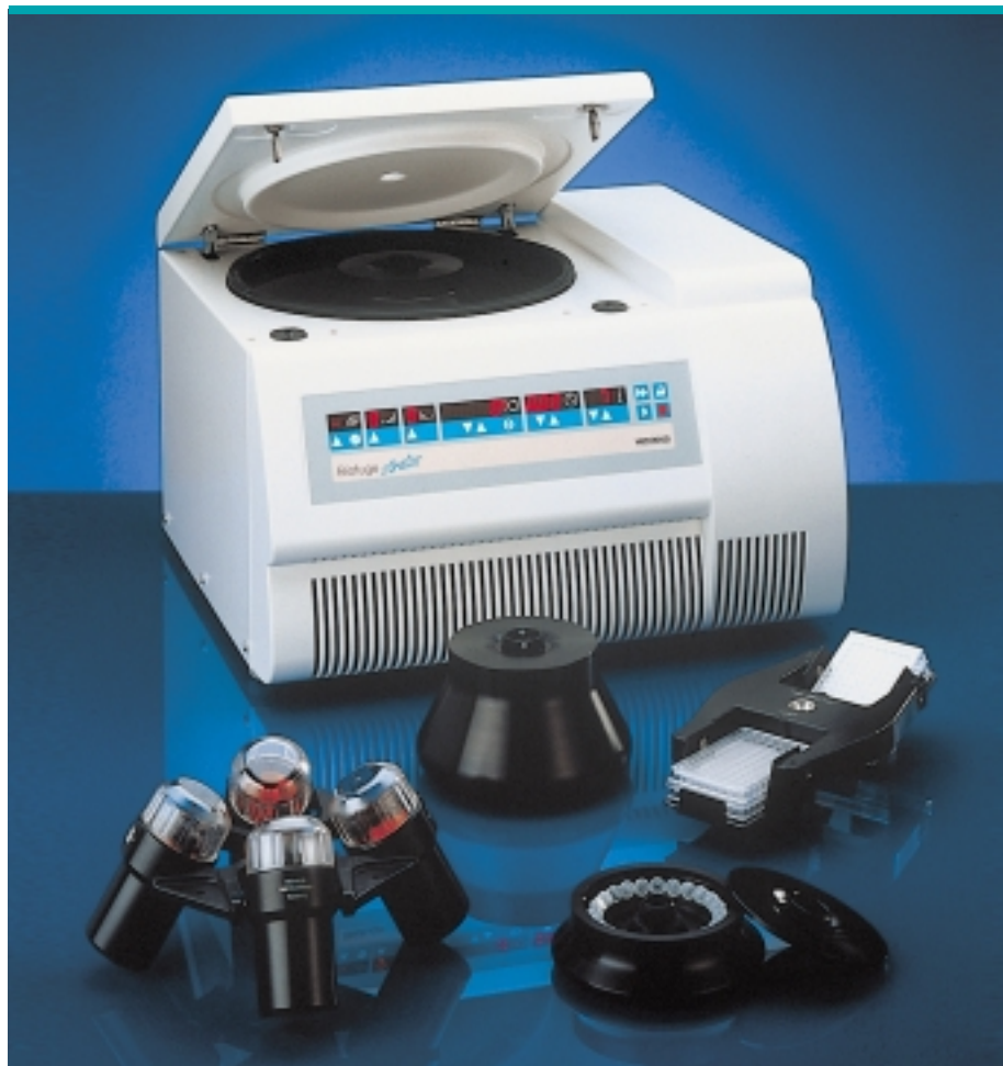
Die flexible High-speed Tischzentrifuge Biofuge stratos

Vervollständigt wird das Zubehörprogramm mit einem 4 x 180 ml Ausschwingrotor für alle Standardgefäße und einem Rotor für 2 x 2 Mikrotiterplatten. Für Spezialanwendungen im Durchflußbetrieb steht ein autoklavierbarer Titanrotor zur Verfügung.